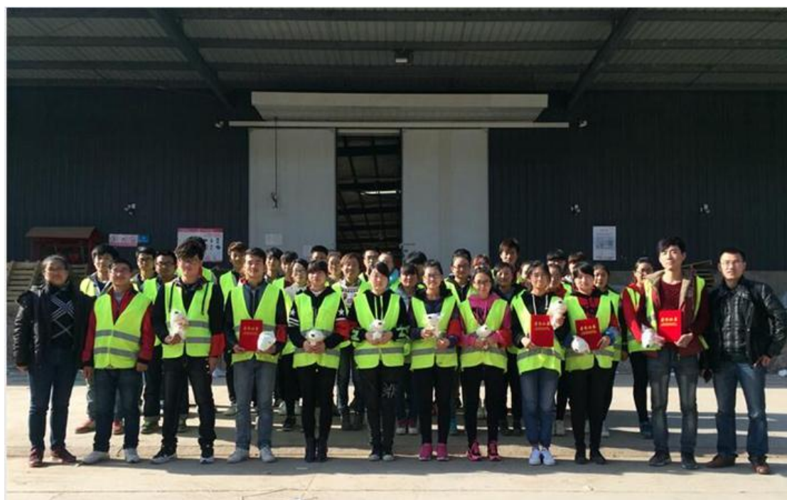
图 8-7 参加京东西北区仓储及配送生产性实习