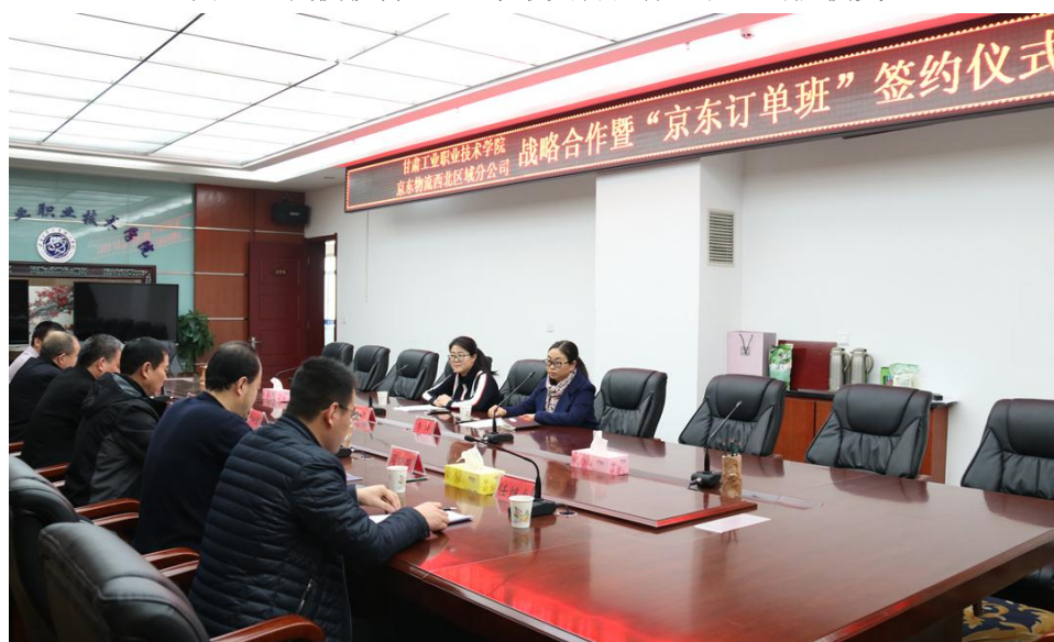
图 8-3 京东订单班签约仪式