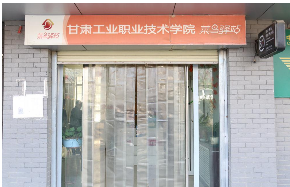
图 8-4 物流服务与电子商务创业基地