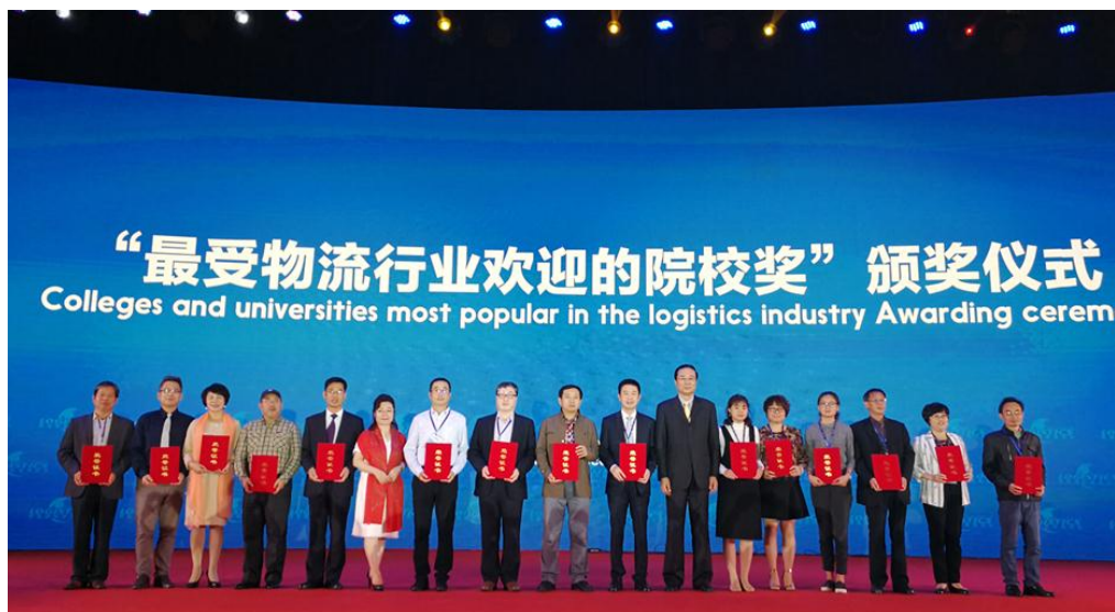
图 8-1 我校获得 2017 年最受物流行业欢迎的院校奖