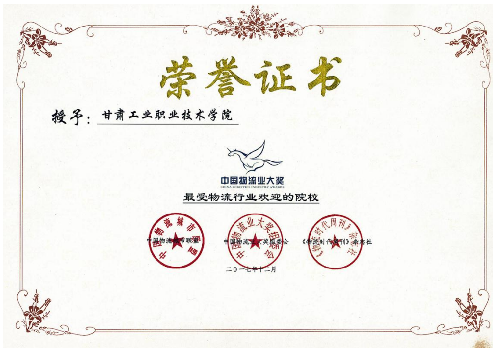
图 8-2 我校获得 2017 年最受物流行业欢迎的院校奖