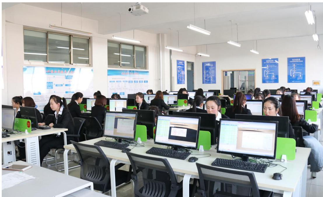
图 8-6 物流仿真软件实训室