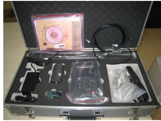
非金属超声检测分析仪 NM-4B